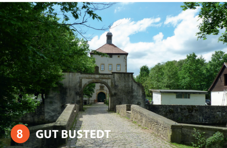
8 GUT BUSTEDT

Gut Bustedt ist eines der wenigen, erhaltenen Wasser-schlösser im Kreis Herford. Die erste Burg wurde schon im Jahr 1415 erbaut. 1649 erhielt es die Form einer Wasserburg, veranlasst durch den damaligen Eigentümer, den Rittmeister Wolf-Ernst Eller. Drei Jahrhunderte gehörte das Gut der Familie Eller, bis das Gut 1964 in den Besitz der Kommune Hiddenhausen übergang. Viele Ländereien gehörten früher zum Gut, Wald, Wiesen und Ackerflächen, insgesamt etwa 170 ha. Heute sind viele Flächen mit dem Gewerbegebiet „Bustedt“ überbaut. Am Turm des Hauptgebäudes sieht man über dem Eingangstor links das Familienwappen derer von Eller, ein Windmühlensiegel mit Brustschild. Rechts ist das Wapen von Juliane Charlotte von Calcum zu sehen, Frau des ersten Eller aus Düsseldorf. Die alte Zugbrücke wurde schon vor langer Zeit durch eine feste Brücke ersetzt. Heute ist Gut Bustedt Sitz des Vereins „Biologiezentrum Bustedt Ostwestfalen-Lippe e.V.“, einem überregional bekannten Bildungszentrum für Schulklassen. Ziegen, Hühner, Schafe und Ponys ziehen die Blicke auf sich, dürfen aber nicht gefüttert werden. Der große Bauerngarten des Biologiezentrums darf gerne betreten werden. Der Aquarien- und Terrarien-Verein im Biologiezentrum Bustedt e.V. nutzt die Flure im Erdgeschoss der Burg für seine Dauerausstellung, die sonntags von 11.00-14.00 Uhr und dienstags von 19.00-21.00 Uhr zu besichtigen ist. Von Piranhas bis zu Madagaskar-Taggeckos gibt viele spannende Tiere zu entdecken.