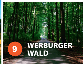
9 WERBURGER WALD

Streuobstwiesen sind ein wichtiger Bestandteil in der Kulturlandschaft des Ravensberger Hügellands. Dienten sie früher noch der Ernährung der Bevölkerung, verschwinden sie heute immer häufiger aus der Landschaft, weil die Pflege aufwendig ist. Um diesem Trend entgegenzuwirken, werden sie gerne als Ausgleichsmaßnahmen für Eingriffe in die Landschaft angelegt. Das Obst schmeckt nicht nur den Menschen, sondern dient auch den Wildtieren als Nahrung. Der Obstbaum kann mit zunehmendem Alter zum Lebensraum für totholzbewohnende Tierarten werden und Höhlenbrütern wie dem Steinkauz dienen.