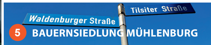
5 BAUERNSIEDLUNG MÜHLENBURG

Vielfach haben nach dem 2. Weltkrieg durchsetzungsstarke und pragmatische Bürgermeister für ihre wachsenden Städte und Gemeinden neues Bauland erschlossen. Aus dem Grundbesitz der Mühlenburg konnte die Stadt Spenge 1955 genügend Fläche für die so genannte Bauernsiedlung erwerben. Vertriebene aus den früheren deutschen Ostgebieten konnten ihre Häuser errichten. Die Straßennamen erinnern an die ostpreußische oder schlesische Herkunft der Geflüchteten.